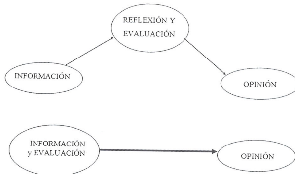
Gráfico 1 Dos procesos en la formación de opiniones, el teórico y el real

Una vez que se ha recibido información se puede tener ya una opinión y pensamos que el proceso es un proceso lógico. Es decir, primero viene el conocimiento, la infor-