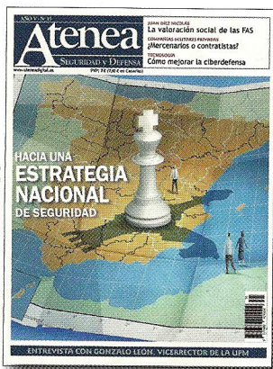
ILUSTRACIÓN: MARAVILLAS DELGADO