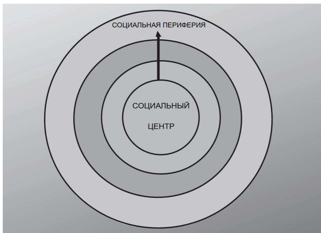
Рис. 2. Модель «центр-периферия»

В итоге мы получаем «концентрическую» теорию общества: в центре находится «ядро принятия решений», «экстремальная периферия» располагается на внешнем пространстве круга (рис. 2).