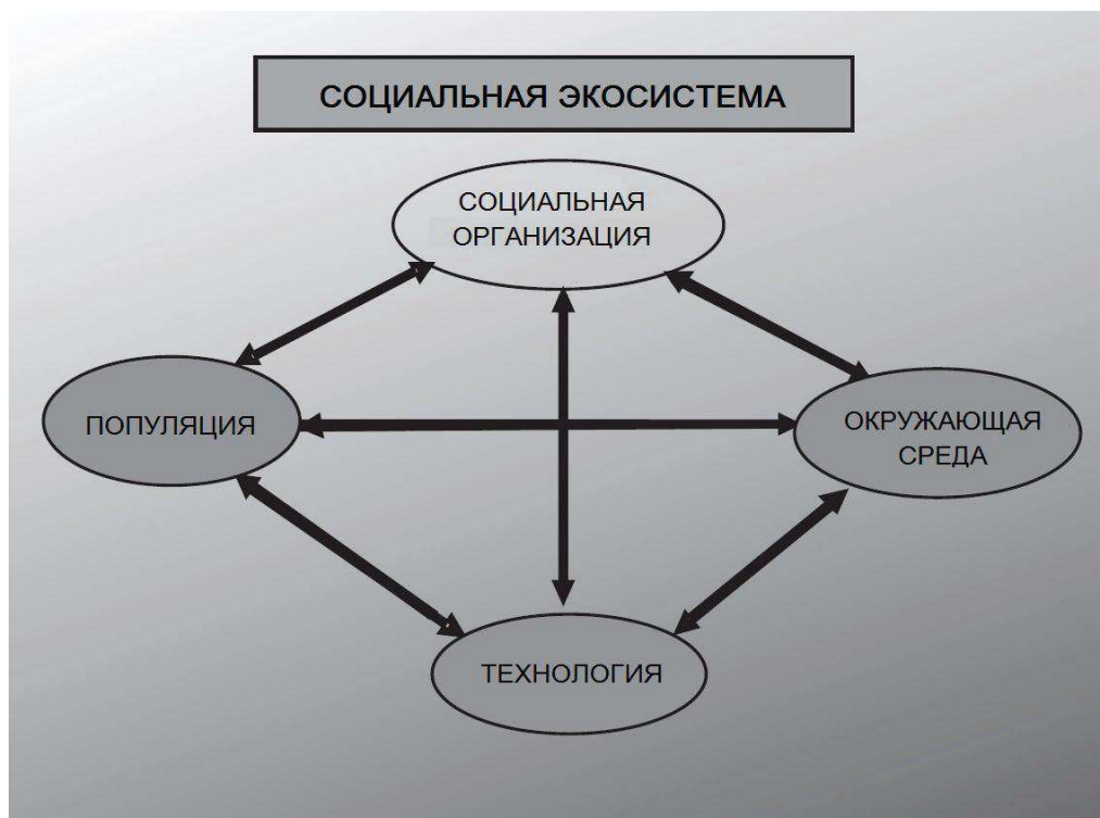
Рис. 1. Модель социальной экосистемы

Четыре элемента экосистемы взаимосвязаны, так что любое изменение, происходящее в одном из них, влияет на остальные и также может вызвать в них изменения. Всякая экосистема стремится к равновесию (демографическому, пространственному/территориальному, функциональному), но никогда не достигает его. Следовательно, любое равновесие нестабильно: в каждом из элементов происходят изменения, вызывая таковые в трех других.