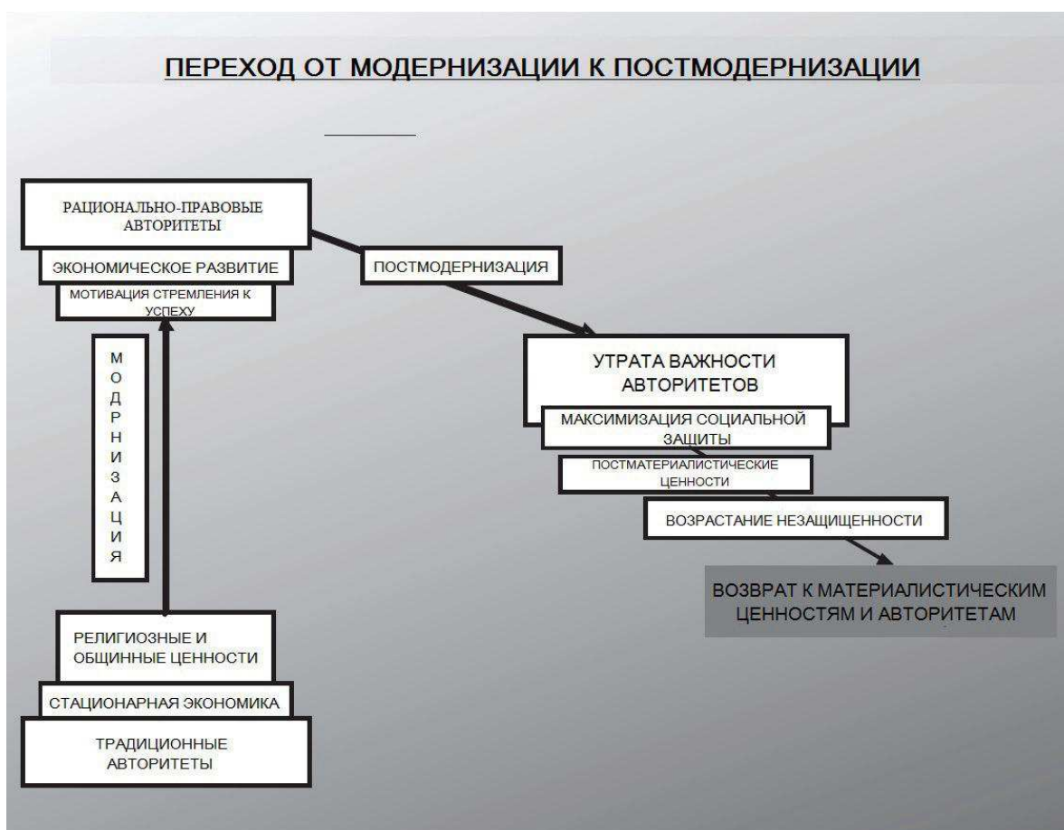
Рис. 4. Процессы модернизации и постмодернизации

Таким образом, согласно данным двум гипотезам, значение новых постматериалистических ценностей возрастает прямо пропорционально показателям экономического достатка и обратно пропорционально возрасту. Иными словами, по мере того, как страны и индивиды улучшают свое экономическое положение, доля населения, которая придерживается постматериалистических ценностей, увеличивается, и чем моложе индивиды (при неизменности всех прочих факторов), тем больше среди них доля тех, кто предпочитает постматериалистические ценности, и меньше доля тех, кто отдает приоритет материалистическим ценностям (рис. 4).