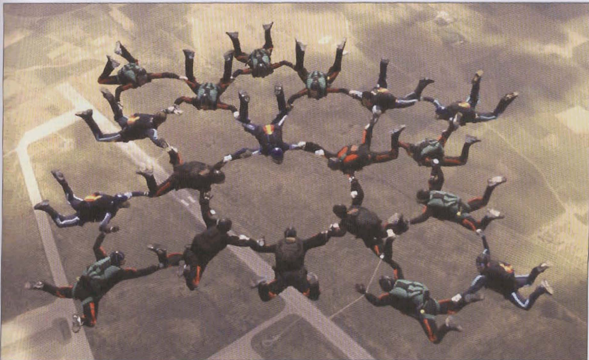
Gabinete Técnico del Ejército del Aire.

Pero el pueblo español no es militarista, de manera que la inmensa mayoría de los españoles prefieren un régimen democrático al de los expertos, al de un líder carismático y al de los militares. La sociedad española es de las más pacifistas, como la mayoría de las sociedades europeas, y por ello, aunque celebra el nuevo papel de sus Fuerzas Armadas en misiones internacionales, suele ver con gran desconfianza la participación en misiones que puedan entrañar peligro para la vida de los militares. Y, finalmente, los españoles prefieren que en el futuro haya un solo ejército mundial bajo mandato de las Naciones Unidas, pero se prefiere un ejército europeo a la OTAN. ■