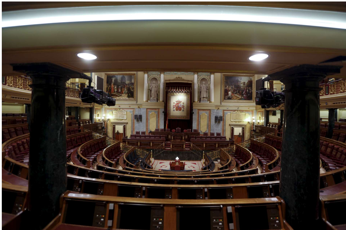
Hemiciclo vacío del Congreso de los diputados